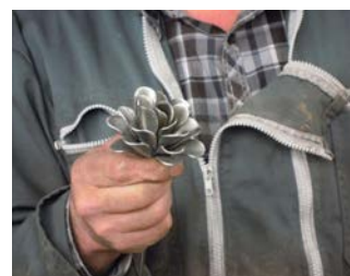
Art de Fer

Informations et autres idées de visites sur www.chartreuse-tourisme.com/rsf ou sur la carte de la Route des Savoir-Faire et des Sites Culturels (disponible gratuitement dans les offices de tourisme du massif).