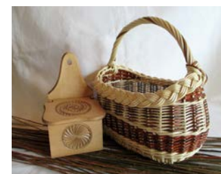
Bois & liens